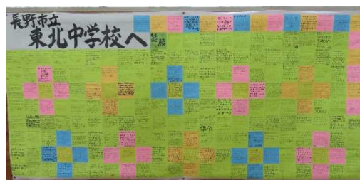
青森県東北町立東北中学校からの応援メッセージ