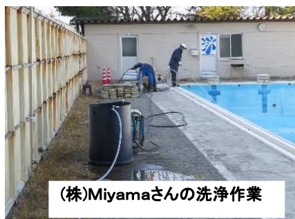
(株)Miyamaさんの洗浄作業